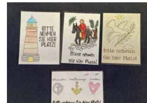
Von Kindern gestaltete Platzkärtchen in der katholischen Kirche