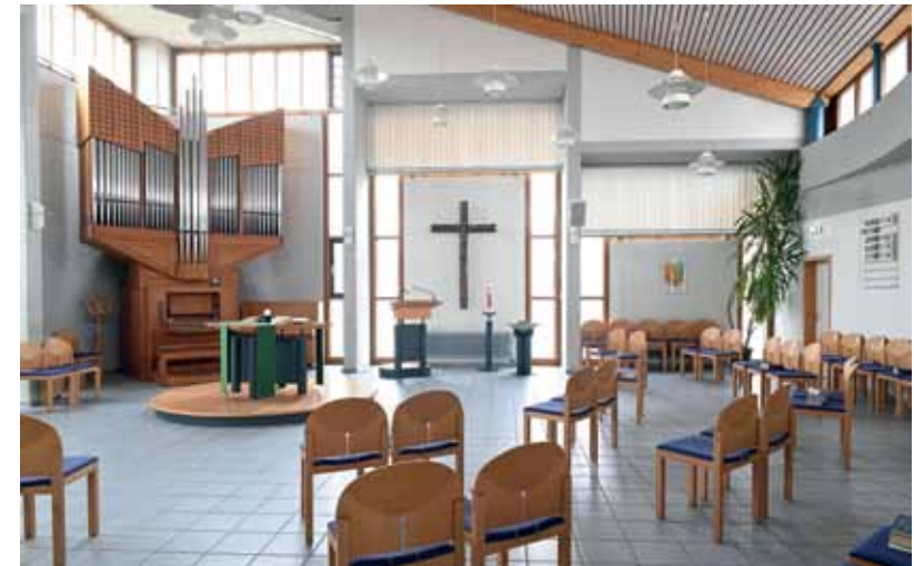
Corona-Bestuhlung in der evangelischen Kirche

Viele der sonst vertrauten Gesichter fehlten in dieser Zeit und so bleibt zu hoffen, dass nach Corona wieder mehr Men-