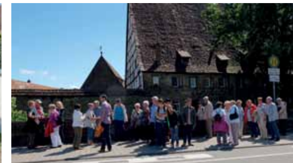
Gemeindeausflug Maulbronn 2013