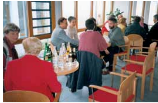
Erstes ökumenisches Kirchencafé