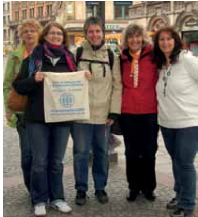
Ökumenischer Kirchentag 2010